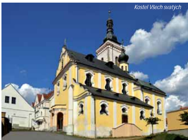
Kostel Věch svatých

Z Kladrub je možné vydat se po modré turistické trase do Stříbra , kde bychom neměli opomenout původně gotický kostel Věch svatých.