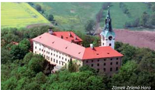
Zámek Zelená Hora

opravu a využití. V současnosti je zámek pronajat obcí Klášter soukromému vlastníkovi a z důvodu rekonstrukce je pro veřejnost uzavřen.