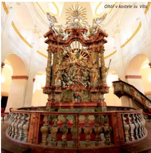
Oltář v kostele sv. Víta