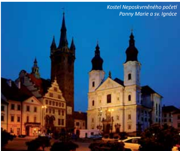
Kostel Neposkvrněného početí Panny Marie a sv. Ignáce