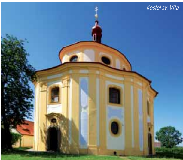
Kostel sv. Víta