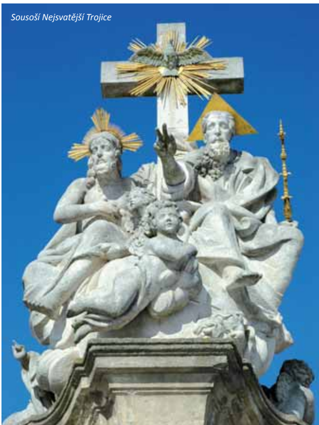
Sousoší Nejsvatější Trojice