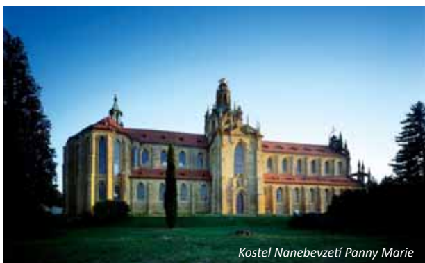
Kostel Nanebevzetí Panny Marie

konventu kláštera je Kilián Ignác Dientzenhofer (1739). V rámci prohlídkových okruhů jsou přístupné expozice věnované řádu benediktnů a sv. Janu