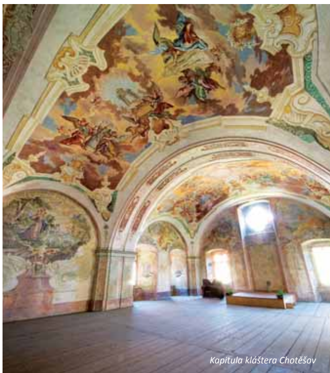
Kapitula kláštera Chotěšov