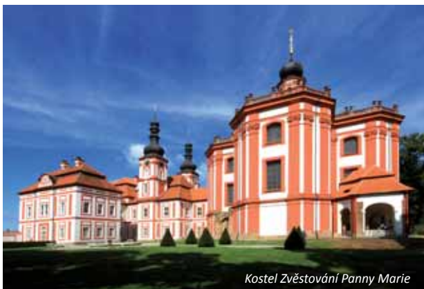
Kostel Zvěstování Panny Marie