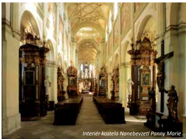
Interiér kostela Nanebevzetí Panny Marie

konventu kláštera je Kilián Ignác Dientzenhofer (1739). V rámci prohlídkových okruhů jsou přístupné expozice věnované řádu benediktnů a sv. Janu