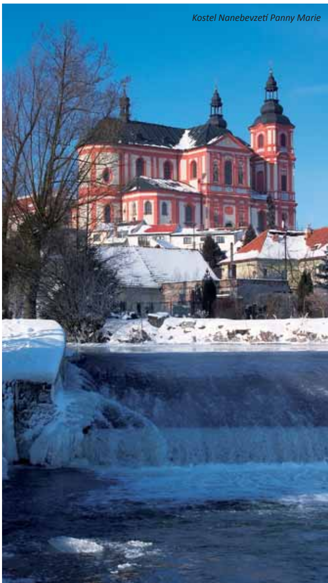
Kostel Nanebevzetí Panny Marie

V těsném sousedství kostela se nachází barokní děkanství z pol. 18.stol. Další barokní památky naleznete v Přešticích na náměstí, kde je mariánský sloup z konce 17.stol, barokní sochy sv. Kiliána a sv. Jana Nepomuckého z 18.stol a pozdně barokní kašna se sochou sv. Václava.